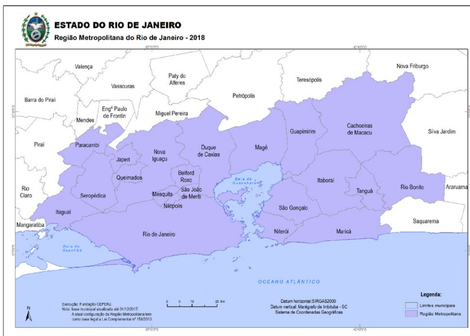
Figura 2: Shows the map of the metropolitan region.